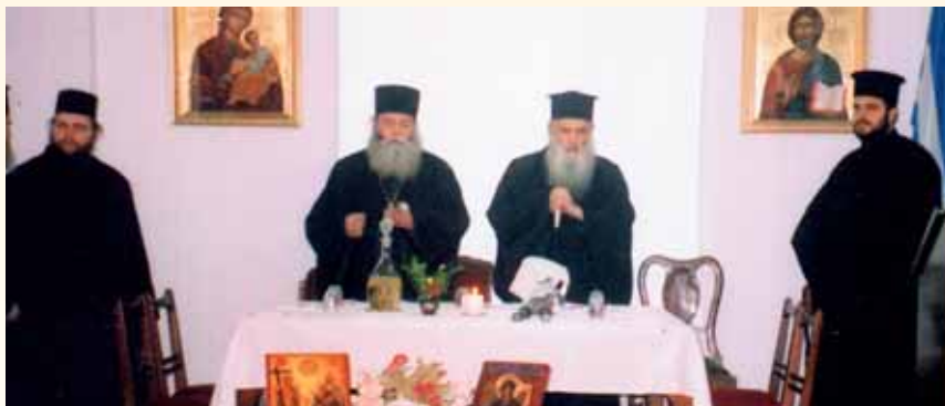
Ὁ Μητροπολίτης κ. ΓΑΒΡΙΗΛ στήν Ἱεραποστολή μέ τό Σεβ/το ΚΩΝΣΤΑΝΤΙΝΟ. Παρευρίσκονται ὁ π. Μπόρις καί ὁ π. Νικόλαος (ἀδελφία), ἐκ Βουλγαρίας.

Ὁ Μητροπολίτης ΛΟΒΕΤΣ (ΒΟΥΛΓΑΡΙΑΣ) † ΓΑΒΡΙΗΛ