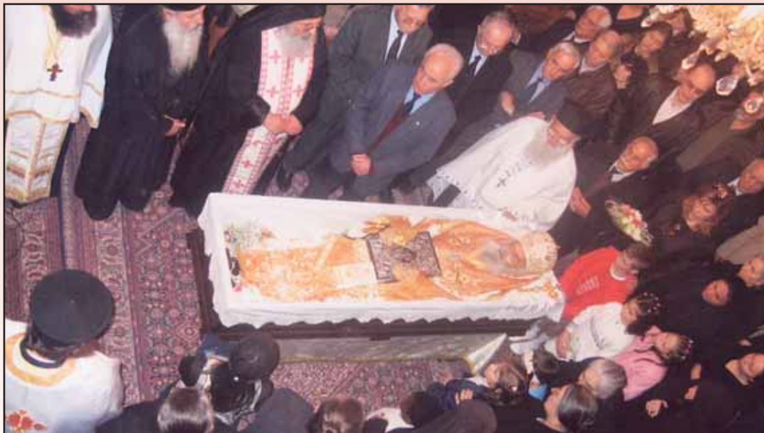
Τό ἱερόν λείψανο στό Μητροπολιτικό ναό Λεβαδείας