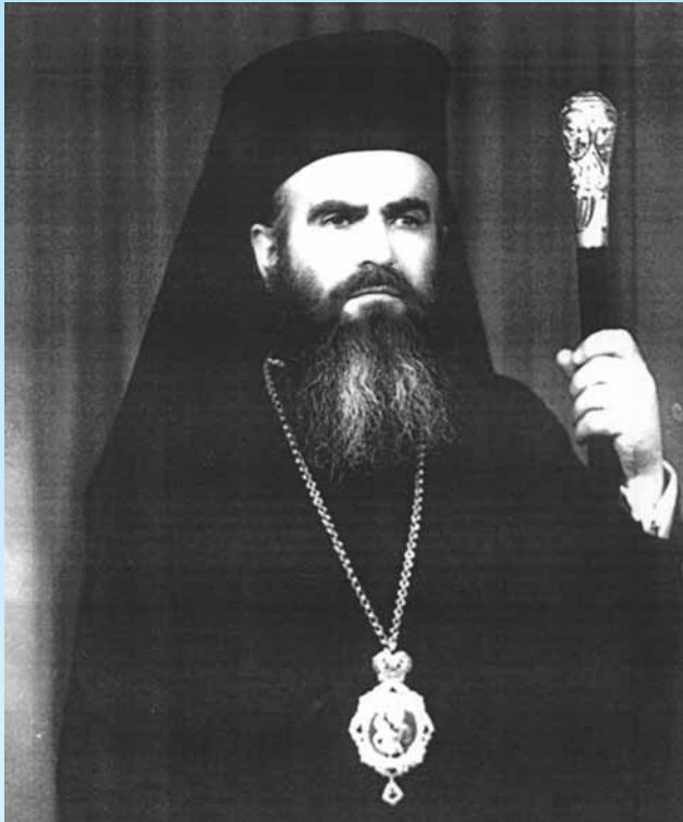
‘Ο Σεβ/τος κυρός ΚΩΝΣΤΑΝΤΙΝΟΣ, νεοχειροτονηθείς ΑΡΧΙΕΡΕΥΣ (1968)

‘Ο Π.Χ.Ο. αισθάνεται βαθύτατα τήν ανάγκη νά εύχαριστήσῃ θερμότατα ὄσους παρευρέθησαν κατά τήν ἐξόδιον ἀκολουθία τοῦ Πνευματικοῦ μας Πατέρα, μακαριστοῦ Κων/νου καί ἐκείνους πού μᾶς ἔστειλαν συλλυπητήρια fax, τηλεγραφήματα, γράμματα, ἤ ἀκόμη καί ἐκείνους πού δέν μπόρεσαν νά παραυρεθοῦν καί νά συμπαρασταθοῦν στή βαρύτατη θλίψη μας. Τά γράμματά τους μέ τό πνευματικό τους περιεχόμενο μᾶς ἐνισχύουν στόν πνευματικό μας ἀγῶνα καί αἰσθανόμαστε τήν ἀγάπη τους. Ἐμεῖς ὀλόψυχα προσευχόμαστε στό Θεό νά ἀνταποδώσει πολλαπλάσια ἀγαθά, σ’ ὄλους ἐκείνους πού ἀγάπησαν, πόνεσαν, συμπόνεσαν τό Σεβαστόν μας Πνευματικό