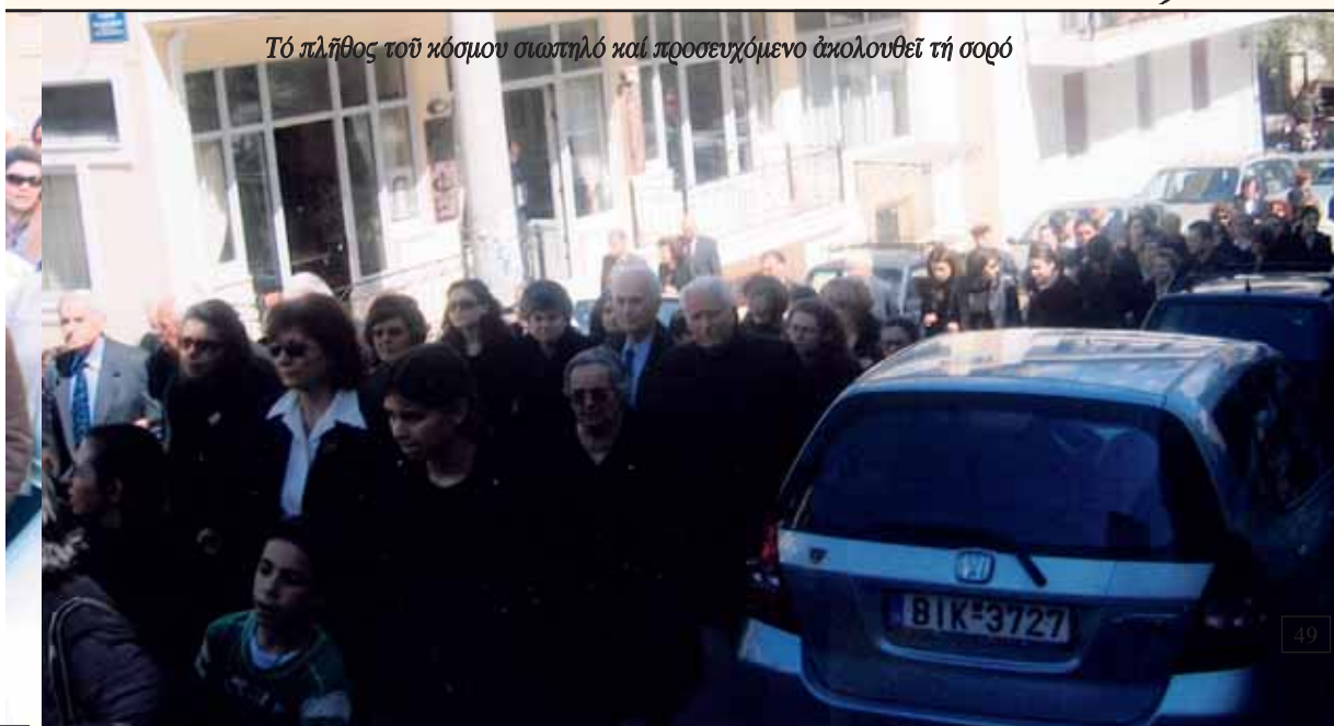
Τό πλῆθος τοῦ κόσμου σιωπηλό καί προσευχόμενο ἀκολουθεῖ τή σορὸ