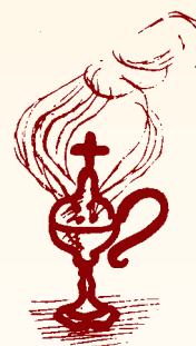
Χαρούμενος ποιμήν λογικῶν προβάτων.