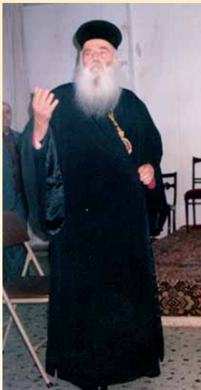
Τό κήρυγμα σκοπός στή ζωή του