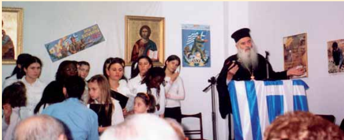
Ὁ Σεβ/τος Κων/νος ὁμιλῶν σέ ἑορταστική ἐκδήλωση τῆς Ἱεραποστολῆς

χωριά ἔστειλε κι ἐμένα νά κάνω κατηχητικό μάθημα, πού εἶχε προγραμματίσει ὁ ἴδιος, ὥστε ἐκεῖνος νά ἐξοικονομήσει χρόνο νά πάη σέ ἄλλα χωριά. Ὁ ἐνθουσιασμός του, ἡ ἱεραποστολική του φλόγα καί ἡ ἀγάπη του πρὸς ὄλους καί πρὸ παντός στά παιδιά, εἶχαν ἐντυπωσιάσει τούς πάντας. Εἶθε τό παράδειγμά του νά βρῆ πολλούς μιμητές.